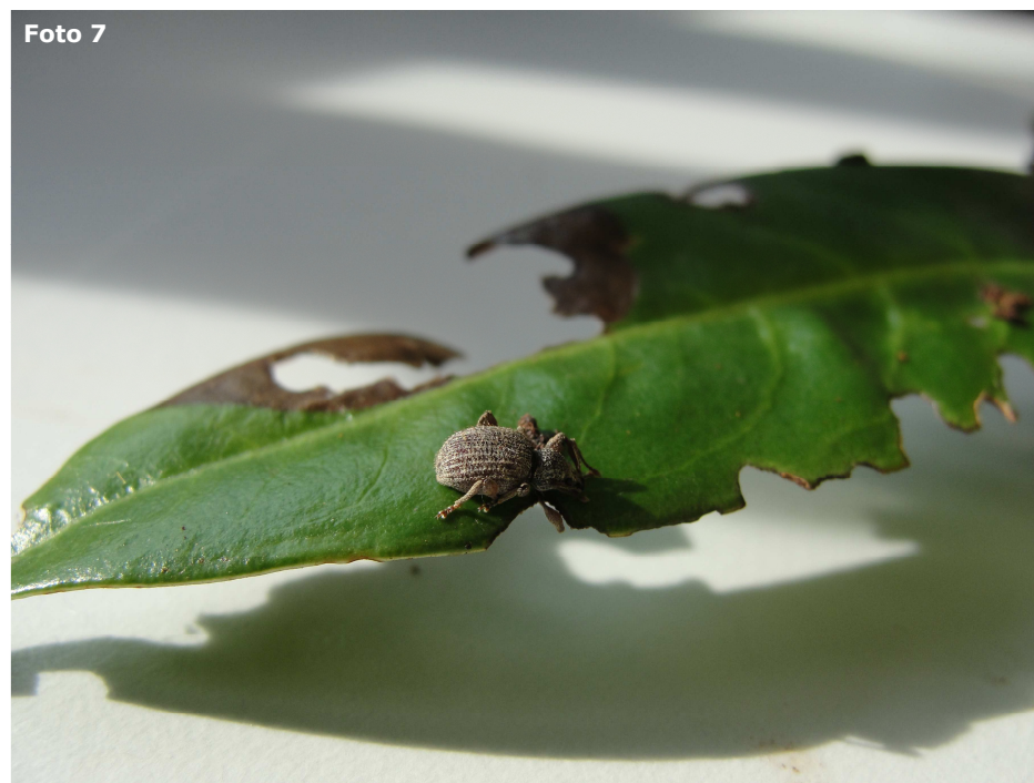
Foto 6: Schade aan bladeren veroorzaakt door een lapsnuitkever